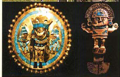
Hallazgo en la tumba del Sr. De Sipán